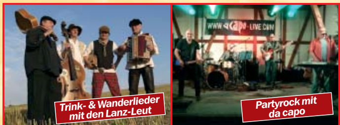
Trink- & Wanderlieder mit den Lanz-Leut

13:00 Uhr Die „Lanz-Leut“ mit Gesellen-, Trink- und Wanderliedern 16:00 Uhr Coverrock mit „The Blue Boys feat. Towarischtsch“ 20:00 Uhr Party-Rock mit „da capo“