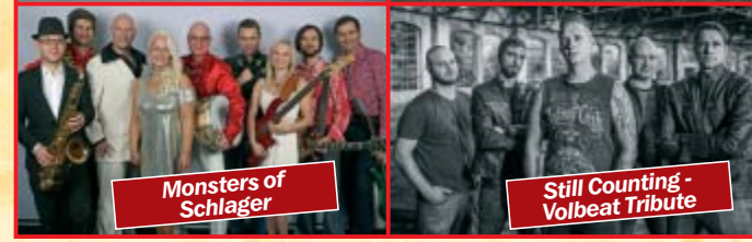
Monsters of Schlager