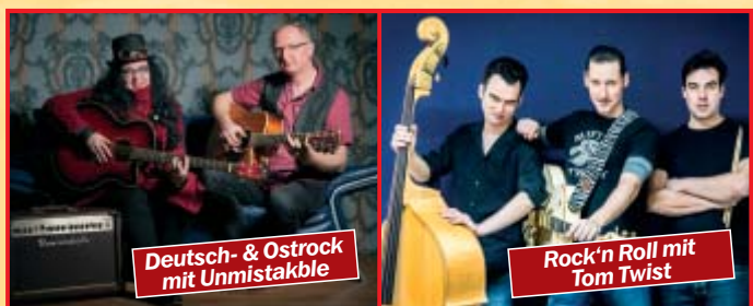
Deutsch- & Ostrock mit Unmistakle

13:00 Uhr Deutsch- & Ostrock mit „Unmistakle“ 16:30 Uhr Country & Oldies dem „Duo Diesel“ 22:00 Uhr „Tom Twist“ - die Rock n' Roll Legende aus Leipzig