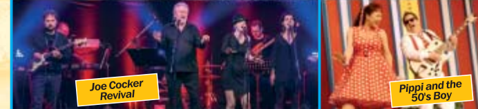
Joe Cocker Revival